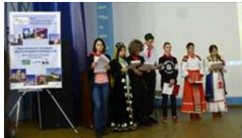
Саратовская Образовательная Экспедиция. Ноябрь 2017. Представление проекта смешанными командами.

Саратовская Образовательная Экспедиция. Учащиеся разрабатывают проект. Объединенные группы учащихся школ Тырныауза, Санкт-Петербурга и Энгельса за разработкой проектов. Ноябрь 2017г