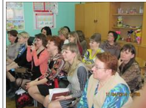
Установочные сессии Скоро стартуют Образовательные Экспедиции

Мероприятие: Семинар разработчиков и экспертов проекта