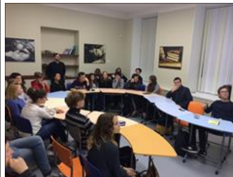
Установочный сессия http://fip.kpmo.ru/fip/project/newsview/5434.html

Мероприятие: Установочная сессия команды ОАНО "ШКОЛА"УНИСОН"