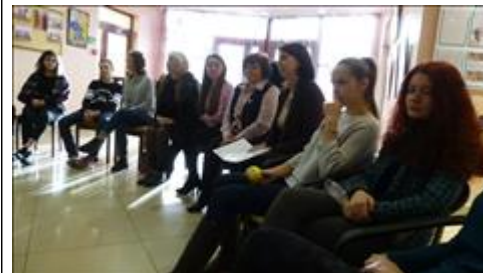
Детско-взрослый семинар Подготовка к Образовательным Экспедициям.