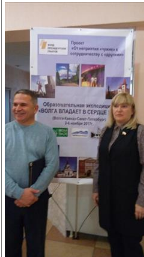
Руководители школ Энгельса и Тынрыауза - одни из разработчиков проекта После конференции в рамках Саратовской Образовательной Экспедиции