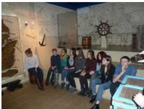
Саратовская Образовательная Экспедиция https://licey1.ru/projects/drugie.html