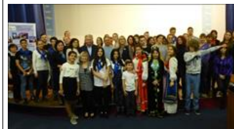
Участники проекта на старте проекта в период Саратовской Образовательной Экспедиции. Ноябрь 2017г. http://fip.kpmo.ru/fip/project/newsview/5525.html