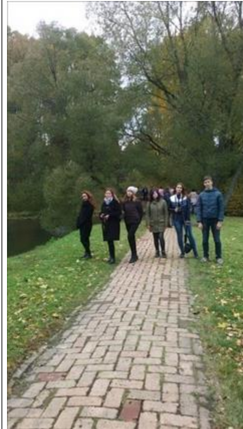
Образовательная Экспедиция в Тарханы Зовут горизонты. Тарханы