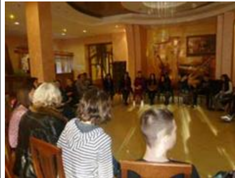
Установочный семинар детско-взрослых групп г. Тырнауза, Энгельса, СПб https://licey1.ru/projects/drugie.html

Мероприятие: Формирование проектных команд