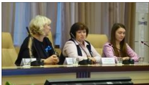
педагогический семинар Подготовка к образовательным экспедициям. Мозговой штурм.